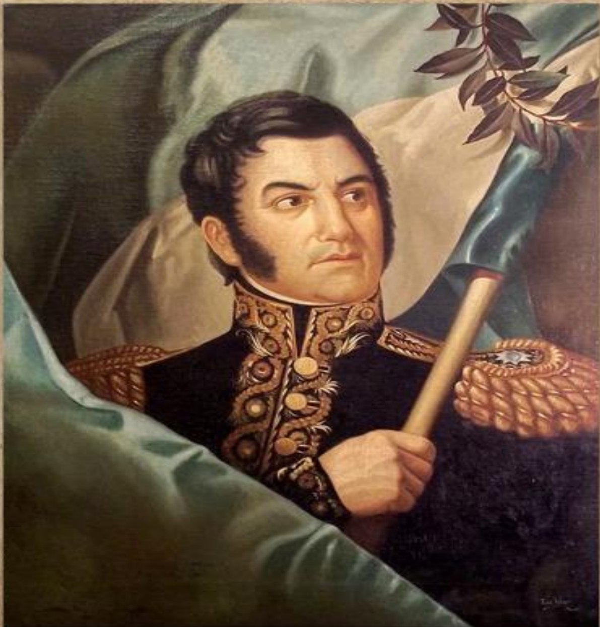
General Don José de San Martín