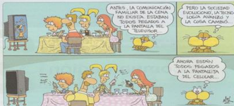
Nik, La Nación, 31 de enero de 2008